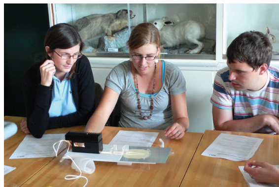
Abb. 3: Phase der Wissensaneignung: Experimente zu den Problemstellungen

Dem Selbststudium zu Hause folgte dann die vertiefte Problemanalyse (Schritt 7, evtl. 8) in der zweiten Wochenhälfte (siehe Abb. 4), oft ergänzt durch zum Thema passende Laborexperimente.