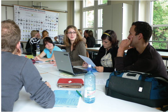
Abb. 4: Vertiefte Problemanalyse